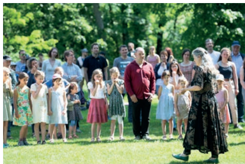
Anleitung eines Tanzes