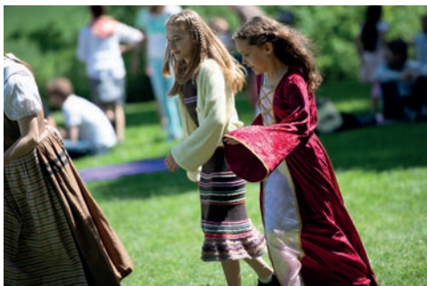
... in Bewegung