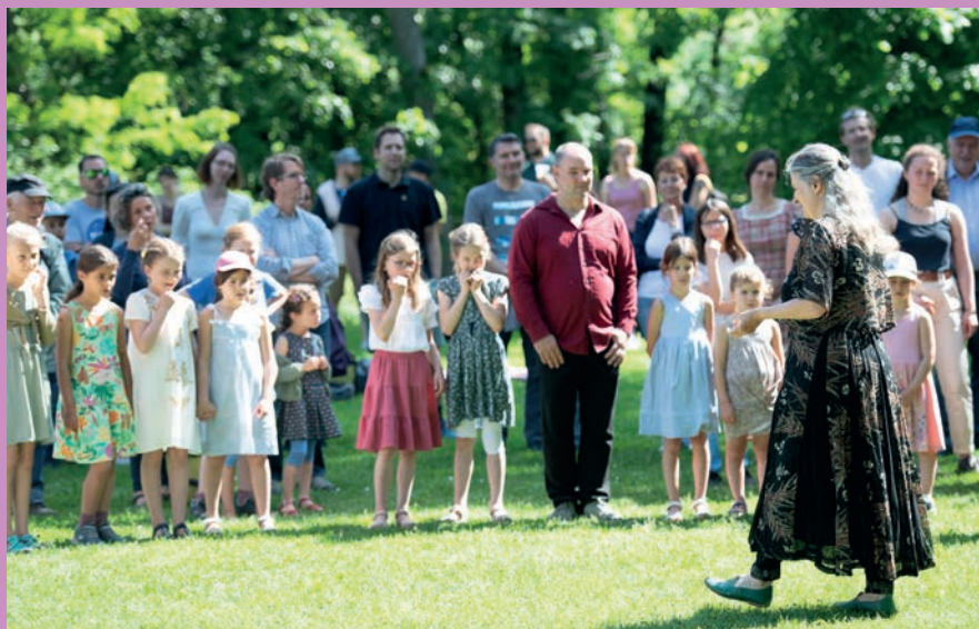
Renaissance-Ball, Mai 2022